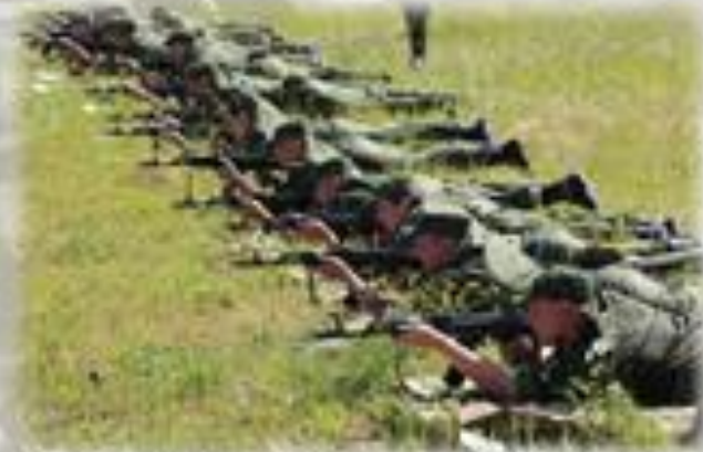
Боевое слаживание на полигоне ДНР