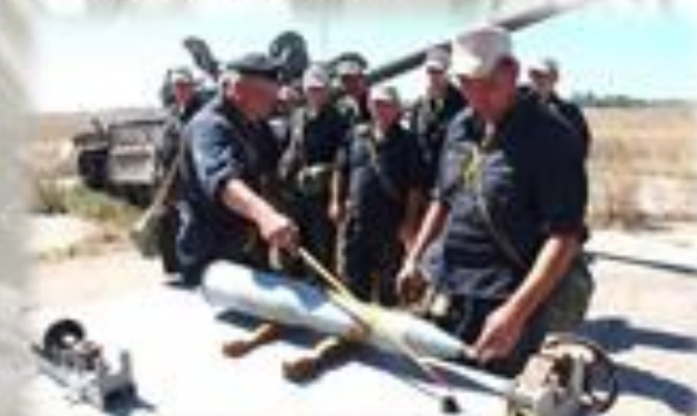
Изучение вооружения и военной техники