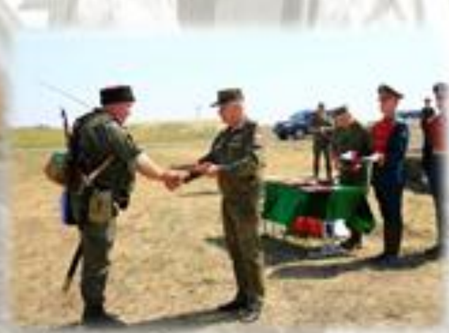
Награждение отличившихся казачков государственными наградами, почетными грамотами и ценными подарками

Российское казачество, исторически сложившееся как военное сословие, – ОСНОВА МОБИЛИЗАЦИОННОГО РЕЗЕРВА РОССИИ