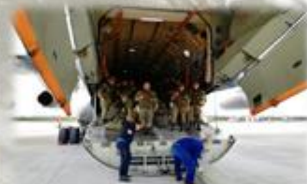
Участие в ежегодных стратегических учениях