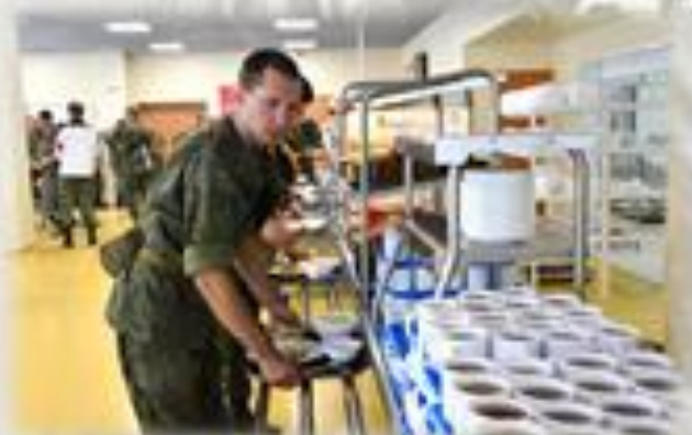
Полное и сбалансированное питание