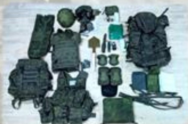
Обеспечение боевой экипировкой и вещевым имуществом