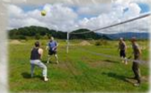
Организация мероприятий выходного дня