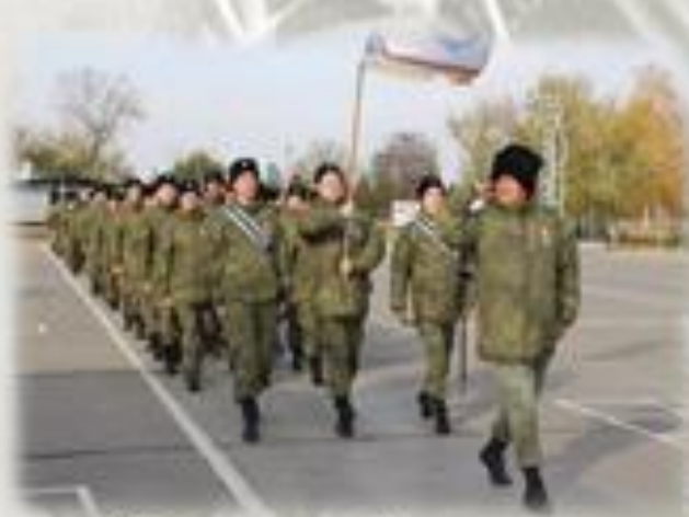
Сборы казачьей роты территориальной обороны мобилизационного людовой резерва