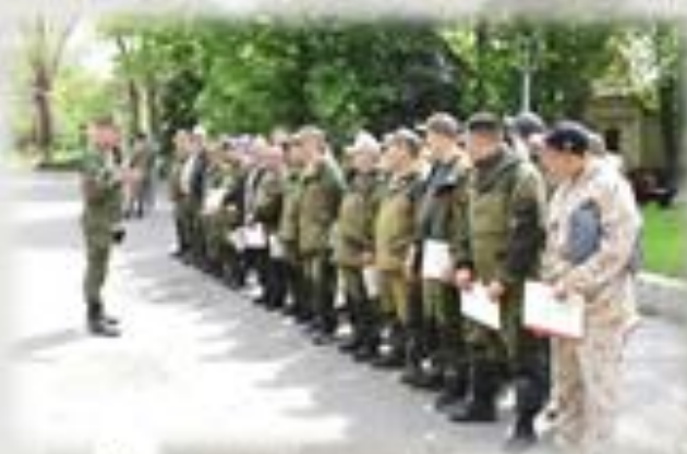
Организация встречи прибывающих резервистов