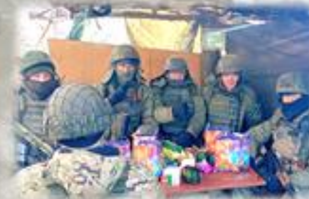
Доставка гуманитарной помощи в отряды добровольцев