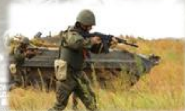
Подготовка на войсковых полигонах