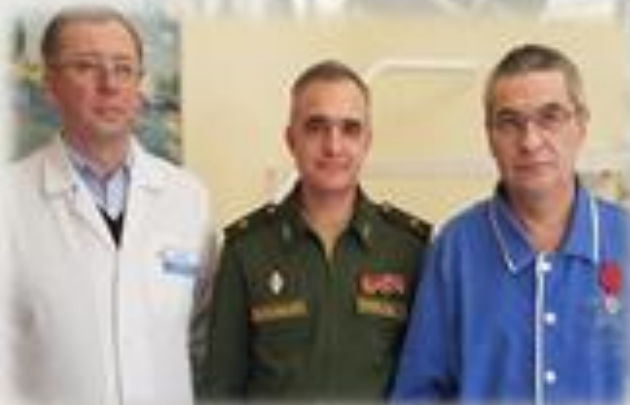
Вручение государственных наград, почетных грамот и ценных подарков