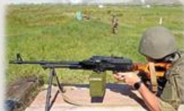
Выполнение упражнений из стрелкового оружия