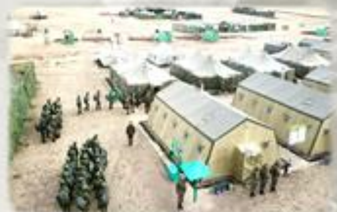
Проживание в палаточном лагере